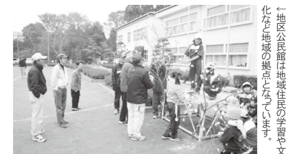
←地区公民館は地域住民の学習や文化など地域の拠点となっています。