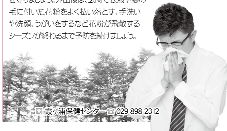
☎ 霞ヶ浦保健センター ☎ 029-898-2312

春の予感とともにやってくる花粉症の季節。花粉症予防で大切なポイントは、花粉に接しないこと。外出する時は、マスクやめがね、帽子の着用を忘れずに花粉から身を守りましょう。外出後は、玄関で衣服や髪の毛に付いた花粉をよく払い落とす、手洗いや洗顔、うがいをするなど花粉が飛散するシーズンが終わるまで予防を続けましょう。