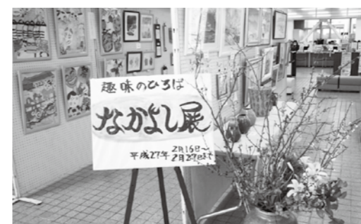
←2月16日から27日まで開催された「なかよし展」(2月26日撮影)