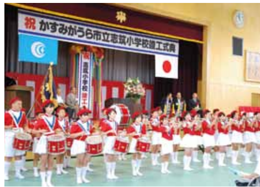
↑最初は、不安でしたが、最後の方では、前に行き写真撮影することができたので、よかったです。

8月25日、志筑小学校の竣工式典に出席しました。初めて一眼レフカメラを持ち撮影に臨みましたが、シャッター音がとても気持ち良かったです。私の撮影した写真がホームページの市長日記に掲載されてとてもうれしかったです。(鈴木さん)