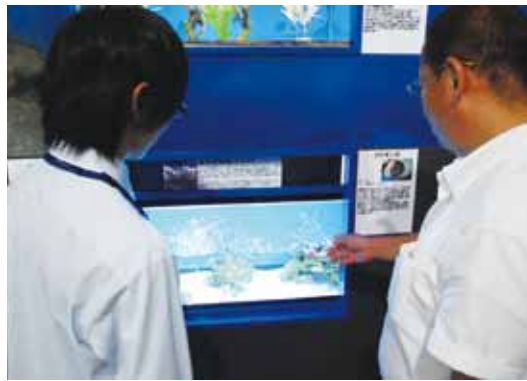
↑水族館長に取材。館長が直接お客様に接客し、説明する「おもてなしの心」に感心しました。

市内観光シャトルバスに乗り、歩崎公園で取材しました。郷土資料館やビジターセンター、あゆみ庵を移動中に大雨が降り、雨宿りして雨が通り過ぎるのを待っていたときに、公共施設に傘のレンタルがあると助かると感じました。(池嶋君)