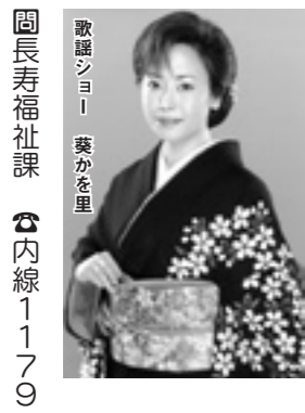
歌謡ショー 葉かを里 岡長寿福祉課 ☎内線 1179

平成21年度のかすみがうら市敬老式典を次のとおり開催します。対象者には案内状をお送りします。 ◆千代田地区 9月19日（土）千代田公民館 講堂 ◆霞ヶ浦地区 10月17日（土）体育センター ◆対象者 敬老の日である9月21日現在で70歳以上の方です。 ◆内容 式典／県警による演奏／歌謡ショー／抽選会