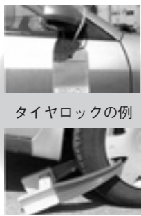
タイヤロックの例

自動車税などの県税や、固定資産税・市県民税・国民健康保険税などの市町村税の納税はお済み