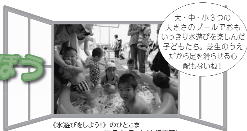
《水遊びをしよう!》のひとこま (7月31日 さくら保育所)