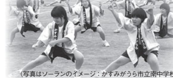
(写真はソーランのイメージ: かすみがうら市立南中学校)