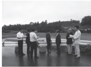
▲市道廃止箇所の現地調査【高倉地区】