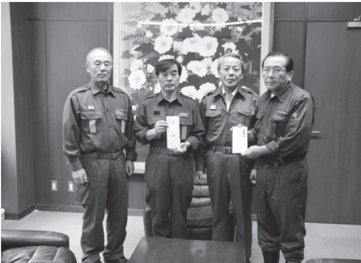
▲常総市へ義援金を届けました。 (左から藤井議長・高杉常総市長・坪井市長・風野常総市議長)

9月10日の台風18号による豪雨で被害に遭われた皆様には、心よりお見舞い申し上げます。一日も早い復旧、復興を心よりお祈り申し上げます。