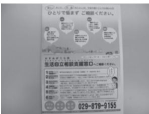
▲生活自立相談支援窓口について