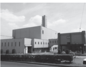
▲新治地方広域ごみ処理場