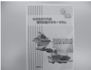
▲かすみがうら市都市計画マスタープラン

2 公共施設等の総合管理計画策定に係る基本方針とまちづくり及び行政サービス水準の関連性並びにスケジュールについて