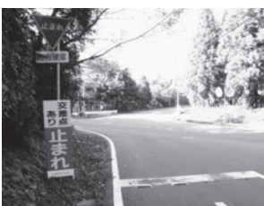
▲注意喚起看板（深谷地区）