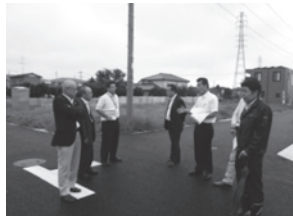
▲市道認定箇所の現地調査【稲吉東地区】