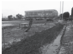
▲冠水した常総市の小学校校庭