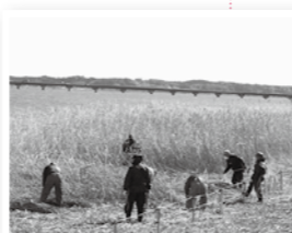
☎ 農林水産課(霞ヶ浦庁舎)

霞ヶ浦のヨシ帯は、鳥類や湿地の植物の生息場だけでなく、コイ科の魚の産卵場所やエビ類の生息場所、水質資源の保護や培養、霞ヶ浦の水質浄化などに大きく役立っています。2月下旬から3月上旬、漁業者を中心とした組織が、柏崎や田伏、加茂のヨシ帯約2ヘクタールの清掃や刈り取りなどの保全活動を行いました。