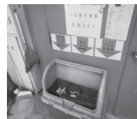
↑環境クリーンセンター回収ボックス