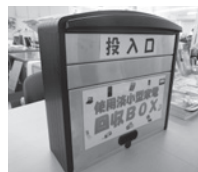
↑環境保全課回収ボックス

環境クリーンセンターにおいて、不燃ごみ、粗大ごみ、直接搬入により出されたごみからピックアップ方式により回収しており、可燃ごみの搬入ピットでも回収ボックスを設置し回収を行っています。本年度より、霞ヶ浦庁舎環境保全課窓口に回収ボックスを設置し、ボックス回収も行っています。