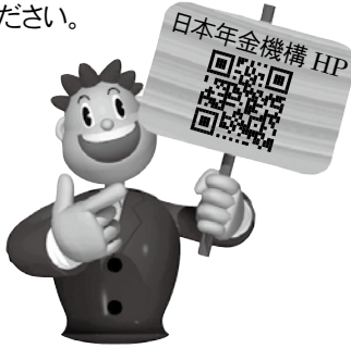
国保年金課(千代田庁舎)

お手続き方法につきましては、日本年金機構ホームページをご覧ください。国保年金課までお問い合わせください。