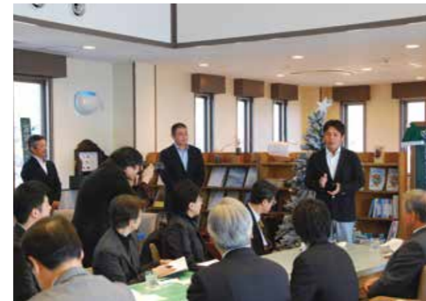
↑「かすみキッチン」では、生産者みずから食材への熱い想いをPR

12月19日、経産省関東経済産業局職員と都内一流ホテルのコンシェルジュが、東京五輪に向けて訪日外国人を誘客するための助言をと、市内の対象事業者を訪問。訪日外国人が関心を寄せる“日本の食”を基本コンセプトに、「野口農園」では独自農法にこだわるレンコンを、「かすみキッチン」では地産地消の料理を試食するなどしました。