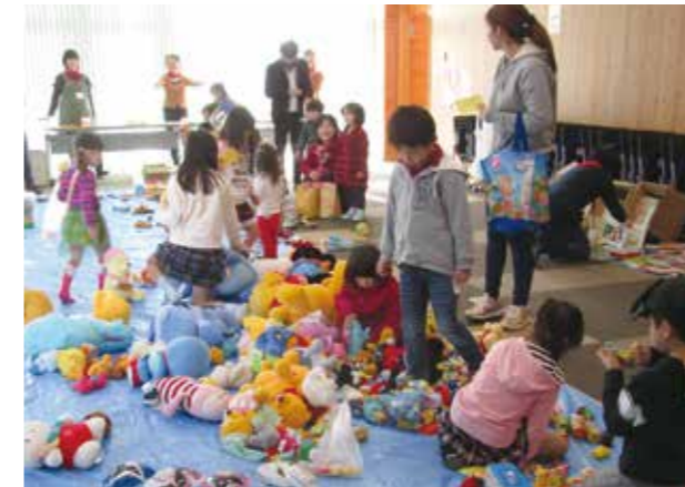
↓たくさんのおもちゃを前に目を輝かせる子どもたち

12月17日、雪入ふれあいの里公園で「雪入 冬のクラフト市」が開催されました。穏やかに晴れた会場では「ミニ門松作り」や「まゆで干支づくり」などのクラフト講座を楽しむ参加者の姿が。地元で採れた柿やミカン、温かい豚汁なども販売され、会場は大いににぎわいました。来場者は「思ったよりも上手にできて、とてもうれしいです」と、完成した作品を前に笑顔で話してくれました。