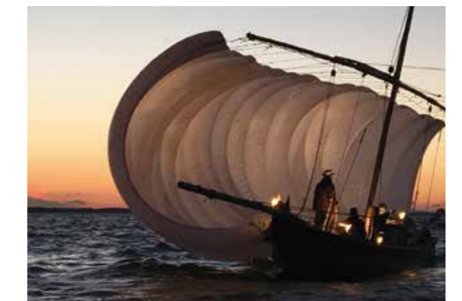
↑夕暮れどきの湖面で優雅な姿をみせる帆引き船

12月10日、歩崎沖合で「月夜の帆引き船ライトアップ操業」が行われました。午後4時に出港した帆引き船。夕暮れとも相まって白帆がきらめきます。太陽が沈みかけるとそこには富士山の姿も。募集定員3倍の申し込みがあった随伴船。乗船した方は「普段は撮れない写真を撮影することができ、大変満足です」と話してくれました。