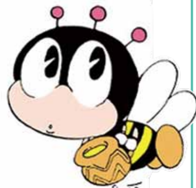
生涯学習センターマスコット『マナビィ』

学習を継続し自らを育て高めると共に社会の変化に対応して、新しい知識・技術を身に付け、人生における生きる目的、生きがいを見つけてみましょう。市では「マナビいかすみがうら」を2回発行し、市民が「いつでも」「どこでも」「だれでも」学びあえるよう進めています。