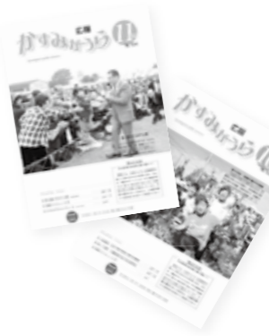
↑広報誌を利用して会社やお店の紹介ができます。毎月20日に発行しています。

対象 市内・土浦市・石岡市・小美玉市・行方市に住所または事業所を有する方 サイズと料金 (全枠)45mm×177mm / 2万円半枠45mm×86mm / 1万円 ②HPバナー広告掲載企業も募集しています(6千円/月)。 ☎秘書広報課(千代田庁舎)