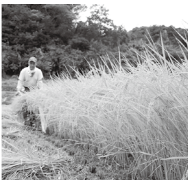
↑「茨城県で農業を始めるには?」「農業法人で働きたい」などとお考えの皆さまが、気軽に相談できる相談会です。

日時 2月16日(日)午前11時〜 場所 イーアスつくば(つくば市) 対象 農業を始めることを前提として ①農業の知識や技術の習得、農業体験などをしてほしい方 ②農業法人へ就職を希望される方 ☎029(301)3833