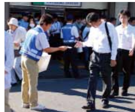
↑神立駅で非行防止キャンペーンを実施

青少年の健全育成に協力する店 登録推進活動 青少年に関係が深く、青少年の健全育成に向けた取り組みにご協力いただける店舗を、「青少年の健全育成に協力する店」と位置づけ、その登録を推進しています。登録いただいた店舗には、登録店舗の遵守事項や業界の自主規制事項遵守に取り組んでいただいています。 普及啓発活動 健全育成や非行防止に関する街頭キャンペーンをあゆみ祭りやかすみがうら祭などに行っています。また、通勤・通学する方が多い時間帯に神立駅などで実施しています。