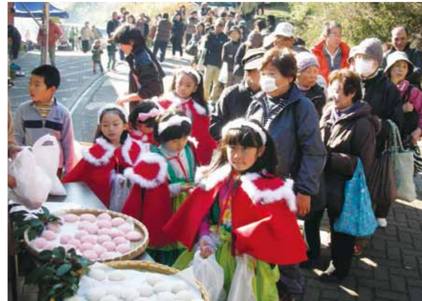
↓フルーツフェアリーの子どもたちによる紅白もちの配布では、長い行列ができました