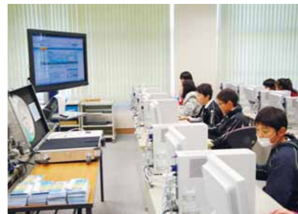
↓学校や教室ではどんな電気が使われているかな？