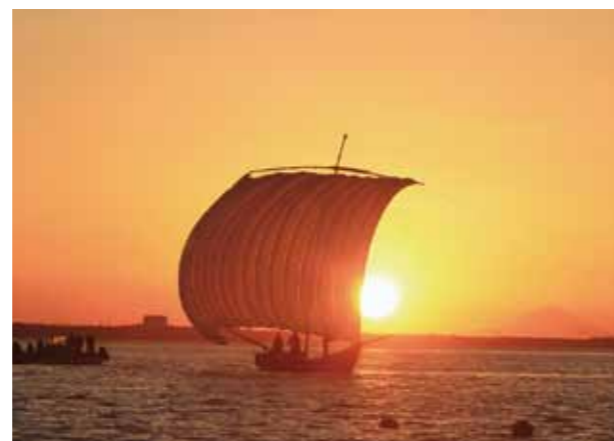
↑遠くに富士山を見ることができました

12月16日、優艶なる帆引き船ライトアップ鑑賞会(霞ヶ浦帆引き船まつり実行委員会主催)が歩崎公園の沖合で行われました。夕焼けに染まる空から富士山のシルエットが浮かび出されると、見学者の歓声とシャッター音が湖上に響き渡り、今年の操業を締めくくる見事な情景を満喫することができました。