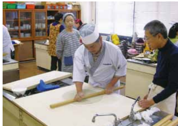
↓講師のお手本を見入る参加者