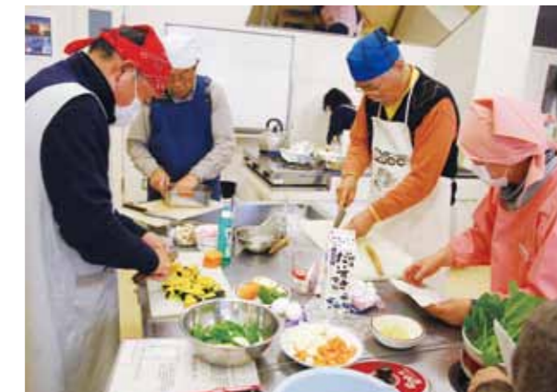
↑食生活改善推進員と一緒に料理に挑戦しました

12月4日、あじさい館で「男の健康楽クッキング」が開催され、頭を三角巾で覆いエプロンをした男性たちが料理に挑戦しました。グループに分かれ、協力しながら「とり肉のホイル焼き」「ほうれん草の中華風炒め」など3品を作りました。参加者は「和やかな雰囲気の中での料理は楽しかった」と笑顔で話してくれました。