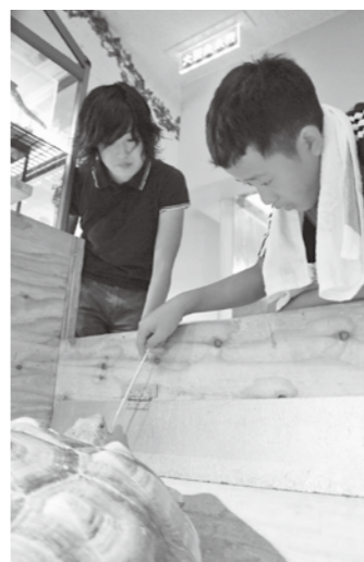
↑水族館スタッフに教わりながらケヅメリクガメに餌やり

7 月24日から8月30日までの夏休み期間中、水族館で「飼育体験」が行われました。小学5年生以上の子どもたちが、日ごろ体験することのできない飼育係の仕事満喫しました。展示水槽の掃除、コイやケヅメリクガメの餌やりなどを体験。コイの餌やりでは、餌に、大きなコイが群がる姿に歓声が上がっていました。