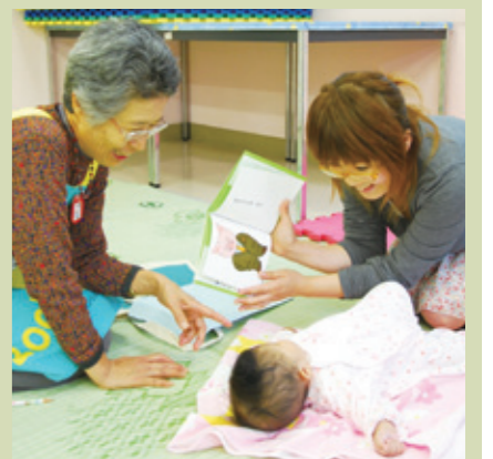
読み聞かせグループ 「つくしんぼ」

ブックスタートは、4カ月児健診のときに、赤ちゃんと保護者にメッセージを伝えながら絵本を手渡す運動で、千代田・霞ヶ浦の両保健センターで行っています。 千代田保健センターでは、ブックスタート・ボランティア14人の方、霞ヶ浦保健センターでは、民生委員児童員16人の方がブックスタート運動を支援しています。