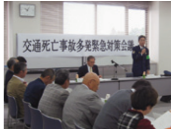
交通安全を呼びかける真家土浦警察署長

10月に入り、市内で交通死亡事故が相次いだことから、市と土浦警察署は、関係機関との緊急対策会議を開催、今後の対応を話し合いました。