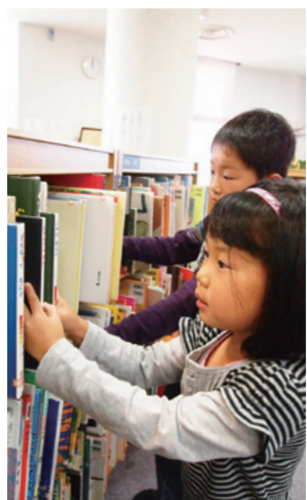
↑児童コーナー。子どもの目線の高さで本を選ぶことができます。

暮らしの中で、情報が持つ価値が高まるなか、利用者が求める情報を手に入れる手段として、図書館の果たす役割が今見直されています。図書館に所蔵していない図書は、リクエストをお聞きし、県内の公共図書館や大学から相互貸借制度で取り寄せることができます。調べたいことで、図書が見つからない場合は、職員に相談してみてください。