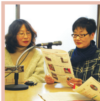
朗読ボランティア 「せせらぎ」

視覚に障害のある方や寝たきりの高齢者など、図書館に来ることが困難な方に、広報誌やエッセーなどを録音して届けています。会員数10人。