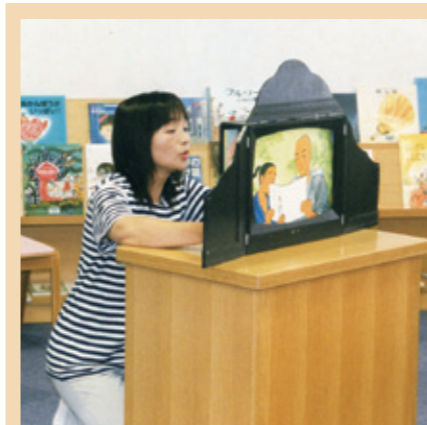
読み聞かせグループ 「石のスープの会」

毎月第2土曜日の午後2時から、子どもたちに絵本や紙芝居などの「お話し会」を行っています。時には、保育所や小学校などで公演することもあります。大好きな絵本の世界を子どもたちと一緒に楽しんでいます。会員数8人。