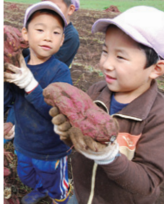
「石焼きいもにしたい！」

市の農業後継者連絡協議会が、霞ヶ浦地区内の保育園（所）の子どもたちと深谷地内の遊休農地に植えたサツマイモの収穫を行いました。イモの形はまちまちでしたが、子どもたちの協力により畑も少し本来の機能を取り戻しました。