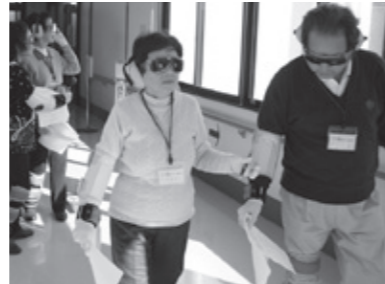
高齢者の視界を疑似体験する 昨年の参加者