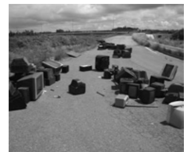
8月の粟田地区の大量の廃テレビの不法投棄現場[目撃情報を集めています]

茨城県は不法投棄撲滅を目指し、6月と11月を不法投棄防止強調月間と定め、警察や県・市町村などと協力し、ヘリコプターによるスカイパトロールや車輦によるランドパトロール、廃棄物運搬車輦一斉検問を行っています。