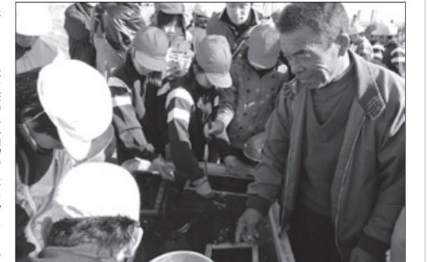
地元漁師からワカサギの人工受精を教わる子どもたち

地域全体で子どもたちの体験活動を支援 佐賀地区公民館は、これまでの活動が高く評価され、第63回優良公民館に選定され、文部科学大臣の表彰を受けました。同公民館は、団体・協力者と連携を図り、地域の史跡を歩く会など、事業に工夫を凝らしています。中でも地域産業体験事業は、地域で将来を担う後継者を育てようとするものです。昨年度は、キウウリ栽培農家や漁師さんが講師となり、佐賀小学校の児童に仕事の苦労や楽しさを教えたこと、世代間交流や住