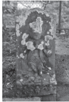
庚申塚に祭られた青面金剛像 (文化12年)

庚申塚に祭られた青面金剛像 (文化12年) 庚申の祭神は青面金剛(仏教)、猿田彦(神道)だと説かれていた。その軸を垂らし、般若心経や庚申真言などのお勤めを済ませた後、共同飲食しながら雑談で時を過ごす、地域コミュニケーションを深める行事でした。