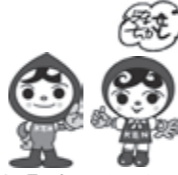
人権イメージキャラクター 人KEN まる君 人KEN あゆみちゃん