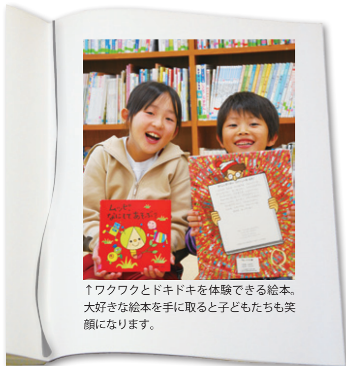
↑ワクワクとドキドキを体験できる絵本。好きな絵本を手に取ると子どもたちも笑顔になります。

図書館の役割やサービス、楽しみ方など取り巻く状況が大きく変わりつつあります。これまで、図書館を趣味や娯楽のための施設、本を無料で貸し出す場所、学生などが勉強するための空間として考えている人も少なくなく、それ以外の機能はあまり知られていませんでした。現在は、新刊図書や並べただけでなく、利用者が見やすく、探しやすいように丁寧と並べられた書架棚、季節や話題などの特集コーナー、本の出会いを演出する書架など利用者が最良の1冊と出会えるよう、さまざまな仕掛けや工夫をしています。