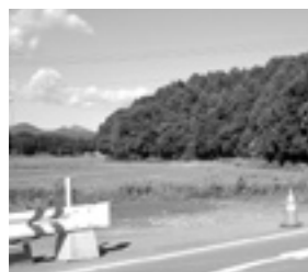
土壘や堀の跡が残る古館周辺（新治橋付近から）

「西野寺」には小字名で「古館」という地名があります。ここは現在うっそうとした森となっていますが、地名のとおり「古館」の存在した形跡がみられます。土壘や堀（防衛施設・虎口（出入り口）などの存在です。土壘の内側には建物が存在したと思われる平場もみられます。