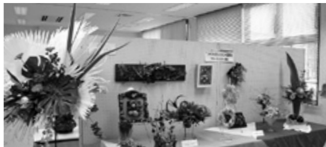
昨年の国民文化祭(帆引き船フェスタ)での作品展示