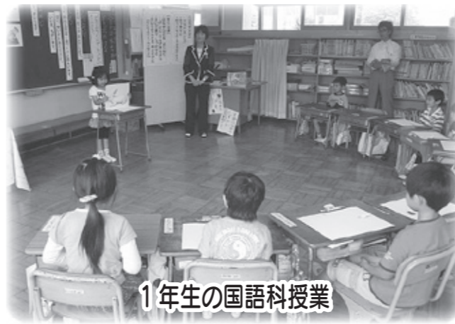
1年生の国語科授業

国語科を中心として「豊かに表現する力」を育てるために、授業の中で学びの機会や学習環境の充実に力を入れています。 ■授業の工夫 国語の授業では、自分の考えを表現する力を高めるために、基礎・基本を押さえ、意見の交流の場を設定するなど工夫をしています。 ■学びを生かす学習環境づくり 1階のプレールームには、「漢字で遊ぼう」「絵手紙」「読書クイズ」「みんなにすすめたい一冊の本」など楽しみながら学べるスペースを設置しています。 ■読書活動の推進 読書ファイルを活用しながら、朝の読書の時間を設定し、本の紹介、職員・保護者による読み聞かせを行なった結果、全児童が年間に50冊以上の本を読んでいます。