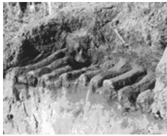
奈良時代の最先端技術であったロストル式平窯跡

「柏崎」には小字名で「瓦谷」という地名があります。この地名が示すように「瓦谷」付近では、以前に瓦が生産されていた。ここから出土する瓦は、奈良時代に建立された常陸国分寺（石岡市）に用いられた瓦で、柏崎で生産された瓦は水運によって常陸国分寺まで運ばれたものと考えられます。その瓦を焼いた窯はロストル式平窯と呼ばれ特徴的な構造をしていました。ロストル式とは、床に何本もの溝をつくり、火焰の回りを良くした構造のもので、都