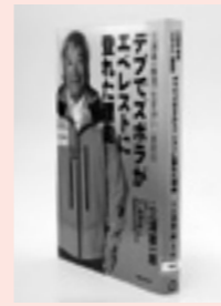
マガジンハウス(刊)

デブでズボラがエベレストに登れた理由(三浦雄一郎) 身長164cm、体重86kgの面倒くさがり屋。エベレスト登頂は、肥満と糖尿病との闘いだった。著者の健康法と生き方を紹介し、高齢化社会を元気に生き抜く知恵を提示する。