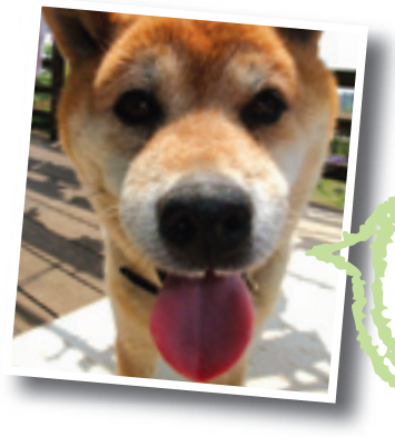
けんた 犬太くん(14) 山崎みゆきさん宅(宍倉)