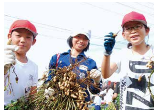
↑たくさんの落花生を収穫し喜ぶ児童

10月4日、下稲吉小学校の5年生児童とその保護者が、学校近くの畑で落花生掘りを体験。親子ふれあいの機会にするとともに県特産品の落花生に関する理解を深めることが目的。掘った落花生は茹でて試食。児童からは「木になると思っていたので驚いた」「塩ゆでした落花生はやわらかくておいしかった」との感想がありました。