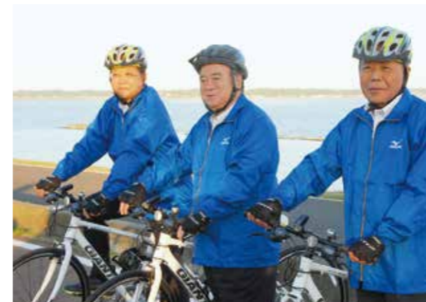
↓視察に訪れた橋本昌知事(中央)と駆け付けてくれた外塚潔県議(左)

10月8日～10日、あじさい館で「ふれあい生涯学習フェア」が開催されました。館内には文化団体や児童生徒の素晴らしい作品が展示され、訪れた人の目を楽しませました。フェア2日目には華やかなダンスや迫力ある和太鼓演奏などのステージ発表。日頃の練習の成果を発揮され来場者を楽しませました。また、切り絵や生け花などの体験教室も行われ、会場は大いににぎわいました。