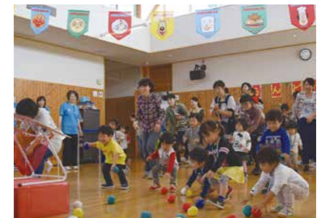
↑「急げ!急げ!」定番の“玉入れ”に笑顔の子どもたち。

10月14日、やまゆり館で運動会が開催され50組の親子が参加。競技は“かけっこ”や“親子遊戯「夢をかなえてドラえもん」”など7種目。無邪気に頑張る子どもたちの姿に、見ている大人たちも自然と笑顔。保護者からは「子どもの楽しそうな表情が見れた」「素敵な思い出ができた」といった感想が。親子のふれあいを楽しんだ一日となりました。