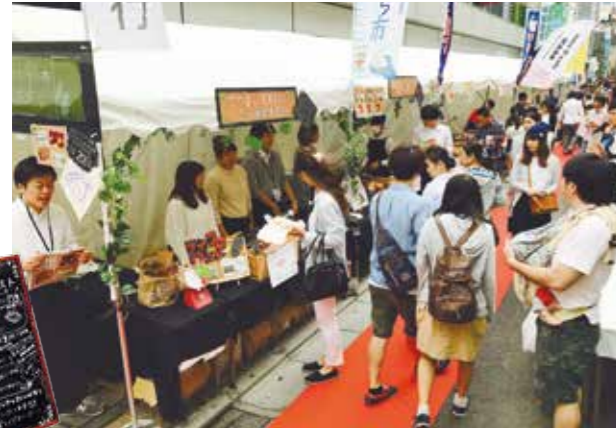
↓特設された茨城物産展通りには県内から7市町が参加

リオパラリンピックで自転車男子個人ロードタイムトライアル(運動機能障害C3)で銀メダルを獲得した藤田征樹選手が、大会報告のため市役所を訪問。3大会連続のメダリストとなった藤田選手は、株式会社日立建機に所属。本市が毎年開催している自転車耐久レース“かすみがうらエन्दューロ”のゲストライダーとして参加をいただいております。