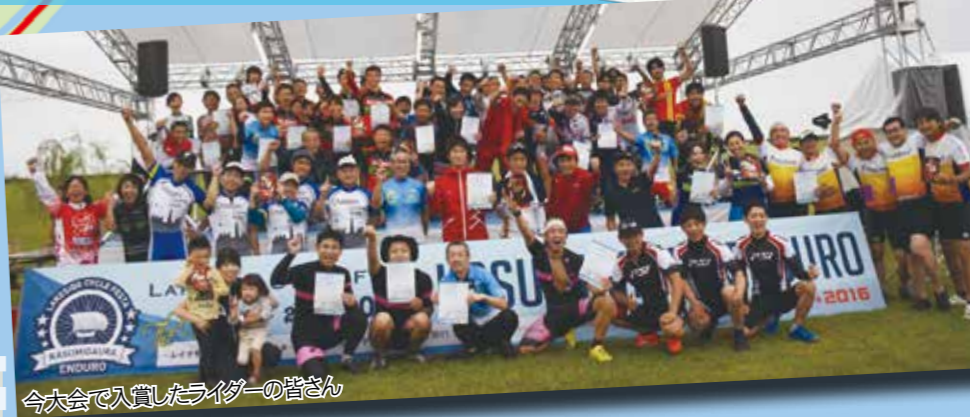
今大会で入賞したライダーの皆さん