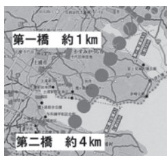
▲霞ヶ浦二橋構想図（抜粋）

4 霞ヶ浦二橋第一橋（八木橋1km）高浜入り架橋ルート及び協同病院接続道路について