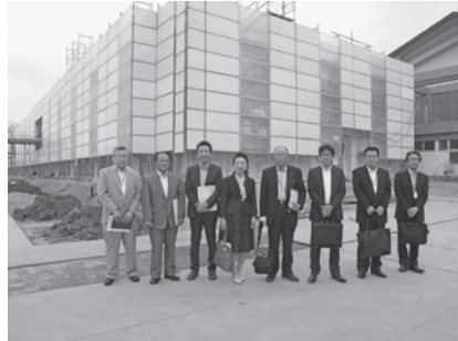
▲新治学園義務教育学校建設地にて