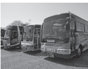
▲霞ヶ浦地区スクールバス