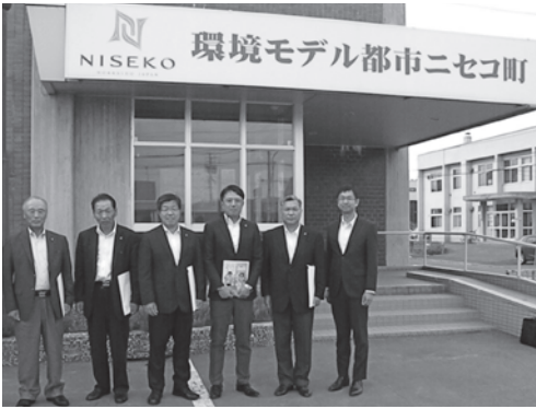
▲北海道ニセコ町役場前にて