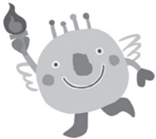
▲いきいき茨城ゆめ国体マスコットキャラクター「いばラッキー」