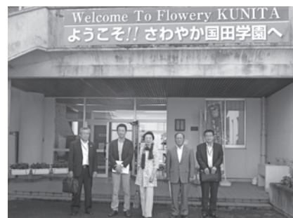
▲国田義務教育学校前にて