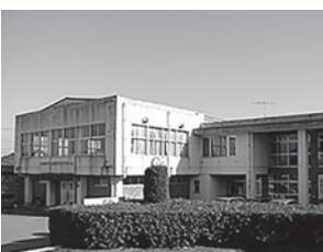
▲勤労青少年ホーム

1 本市の公共施設用地の借地料年間5000万円の課題にかかると今後の具体的な方針、計画はあるのかについて 2 下稻吉中地区における公民館の未整備に対する今後の具体的な方針、年次計画はあるのかについて