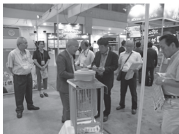
▲土中埋込型コンポスト展示を見学する委員【2017NEW環境展】