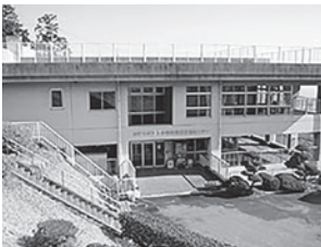
▲農村環境改善センター