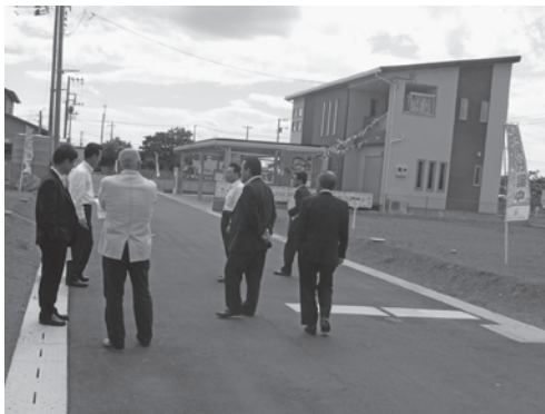
▲市道認定箇所の現地調査【稲吉東地区】