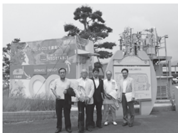
▲佐賀市清掃工場内植物工場前にて