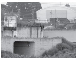
▲工事中の国道6号バイパス（東野寺地内から撮影）

21 6号バイパス整備等の国県事業への当市協力体制は 神立停車場線等を活用した具体的な地域活性化策は