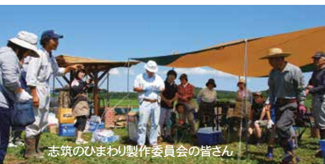
志筑のひまわり製作委員会の皆さん