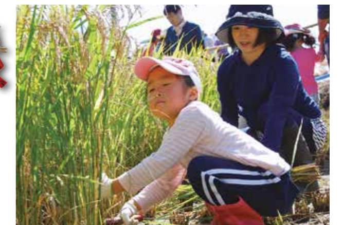
↑慣れないノコギリ鎌を使って一生懸命に稲を刈る親子

9月3日、田伏地内の水田で「古代米づくり教室」が行われました。5月に田植えをした稲が収穫の時期を迎え、参加した親子8組25人が、指導する市民学芸員の皆さんからのサポートを受けながら、手刈りによる稲刈りや刈り取った稲を天日干しにする「おだげ」を体験。昔の農作業の大変さを学び、親子の絆を深めた1日となりました。