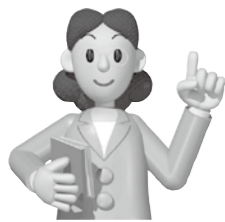
国保年金課 (千代田庁舎)

年末調整や確定申告の際には、必ずこの証明書(または領収証書)を添付してください!