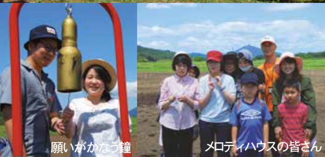
メロディハウスの皆さん