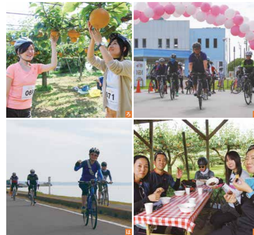
※「ライドクエスト」では、体験をテーマとした市内を巡るサイクリングプログラム「フルーツハンター 2017 夏~秋」を実施中。レンタサイクルも行っています。詳しくはお問い合わせください(☎029-840-9010)、ホームページをご覧ください。