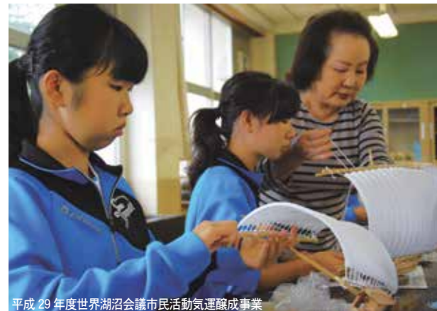
平成29年度世界湖沼会議市民活動気運醸成事業