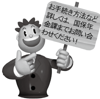
☎ 国民年金課(千代田庁舎)