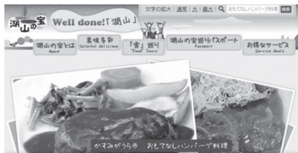
湖山の宝HP : http://www.kozannotakara.com/