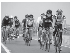
▲かすみがうらエンデューロ