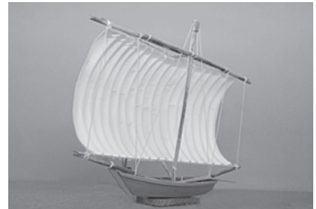
▲霞ヶ浦帆引き船模型(茨城県指定郷土工芸品)

A 平成17年3月に発行した「霞ヶ浦帆引き船物語」、同年7月に発行した特別展展示解説書「帆引き網漁の世界」、平成20年11月に発行した特別展展示解説書「帆引き船と坂本九」を、1冊に再編集するものです。今回300冊作成する予定です。