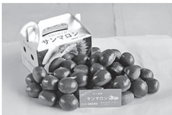
▲太陽のめぐみ「サンマロン」(湖山の宝推奨品)

A 本市では、生産者や事業者の皆さま方の努力によりまして、「湖山の宝」事業に対する一定の評価が得られているところです。今後は、生産者や事業者の皆さま方がブランドコンセプトを自ら確立できるような支援体制、商品のアドバイスや意見交換会を活用しながら、6次産業の育成などの側面から支援してまいりたいと考えております。また、ブランド化推進は、地域が活性化するばかりでなく、本市のイメージアップにもつながっていくものと期待をしております。