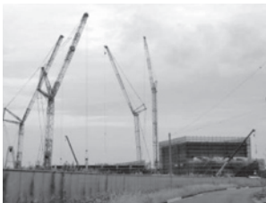
▲土浦協同病院の移転新築現場

A 教育部長 統合前に心配された生徒間の交流、通学路、スクールバス等の案件も、おおむね順調に進んでおります。しかしながら、一部の生徒ではありますが、問題行動を起こしている現状もあります。このような行動に対して、学校では生徒指導の強化やフリー参観等の実施をし、教育委員会としても7月中旬から学校生活相談員を一部配置するなど、解消に向けての対応を図っているところですので。