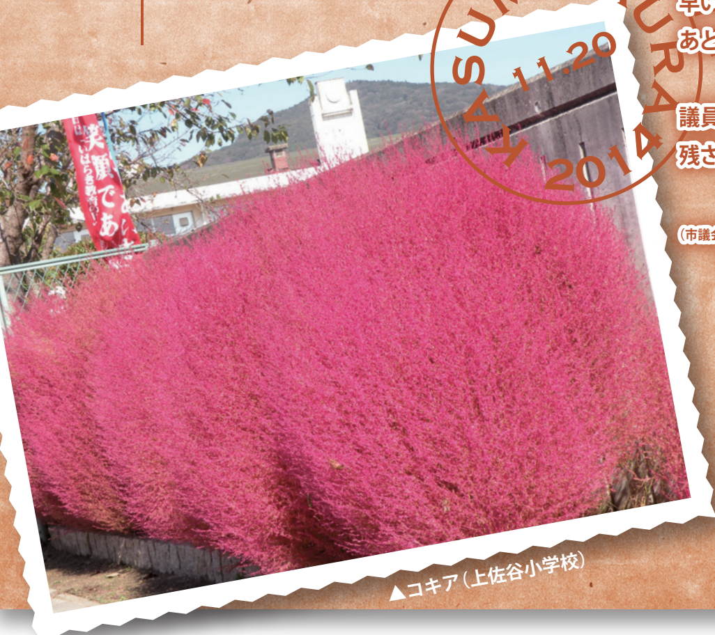
▲コキア(上佐谷小学校)