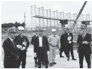
▲土浦協同病院の移転新築現場を視察(10/23) 【土浦市おおつ野地内】