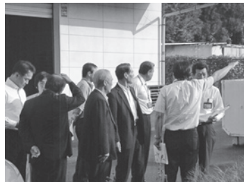
▲市道変更箇所の現地調査 【上軽部地内】