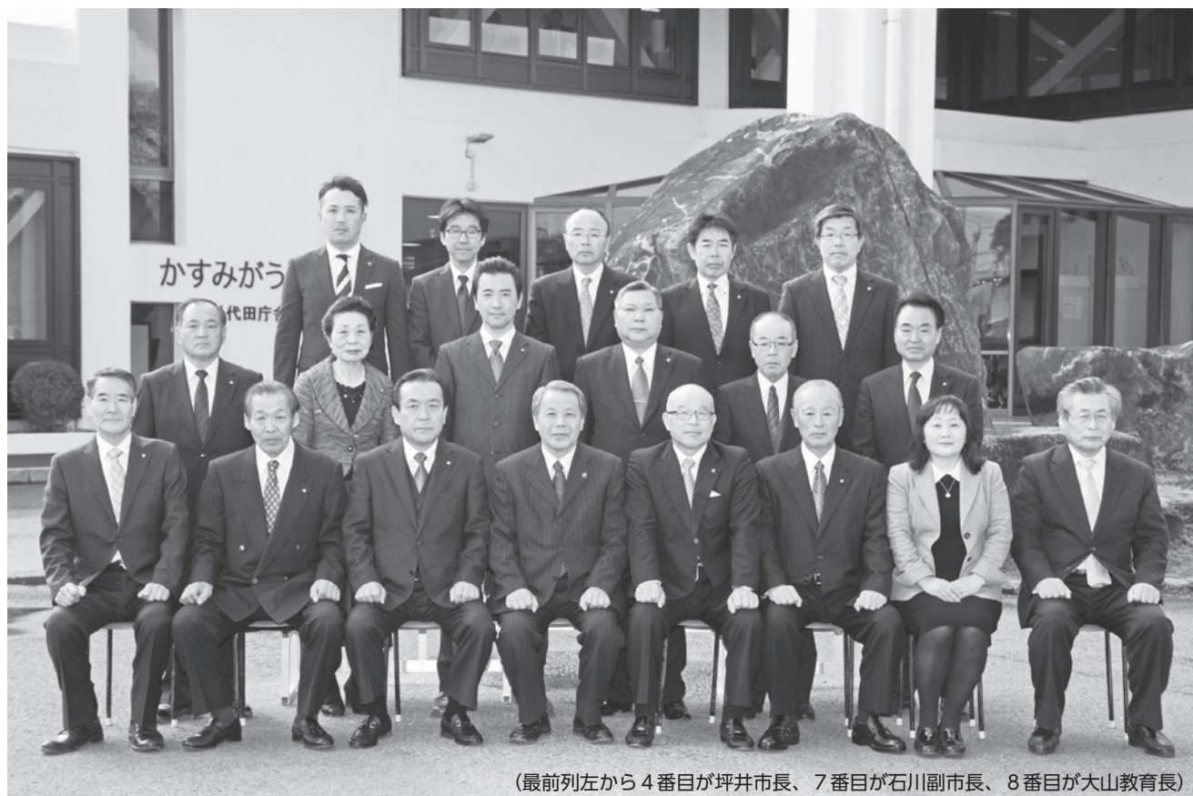
(最前列左から4番目が坪井市長、7番目が石川副市長、8番目が大山教育長)