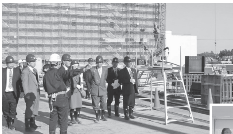
▲建設現場視察風景

地域の中核病院である土浦協同病院の移転新築工事について、視察研修を実施いたしました。