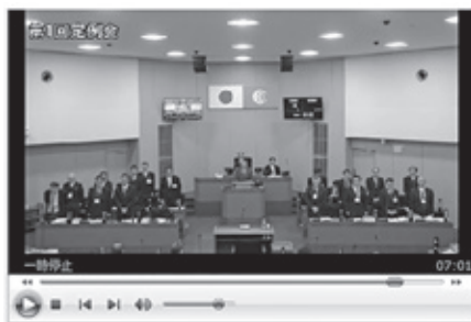
▲録画放映イメージ