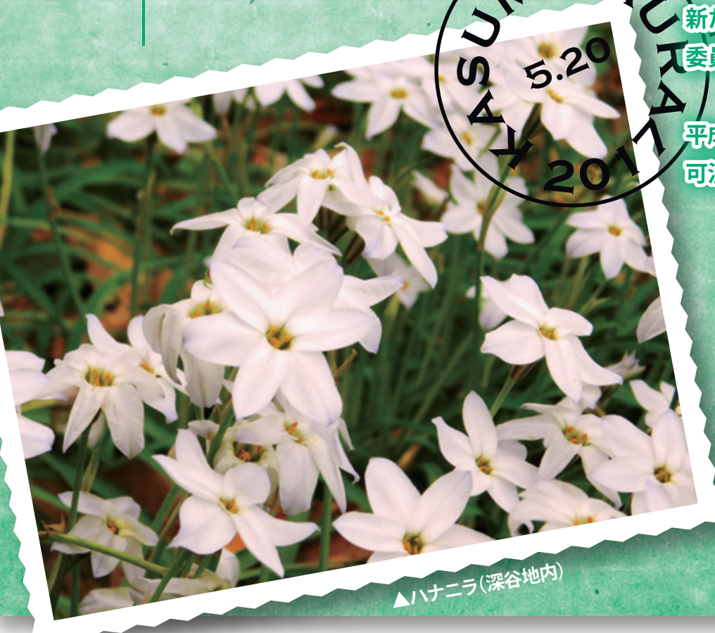
▲ハナニラ(深谷地内)