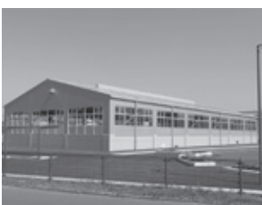
▲霞ヶ浦南小学校プール

321 霞ヶ浦南小学校プールの水温対策について 当市のゴミ処理行政について 市街地の高齢化対策と地域コミュニティの活性化について