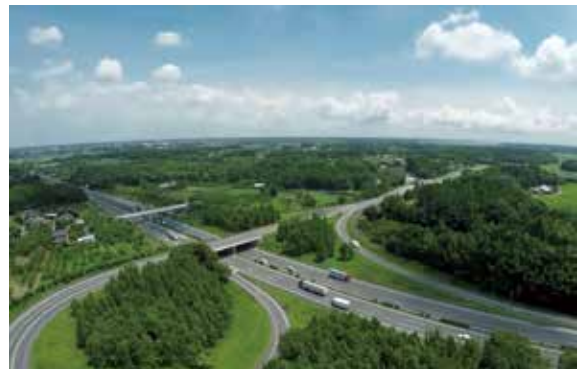
常磐自動車道 千代田石岡インター