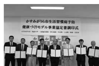
協定書調印式での写真撮影の様子

5月16日、モデル地区(中志筑・上志筑・高倉・五反田)の皆さんと筑波大学、土浦協同病院、神立病院と生活習慣病予防改善健康づくりモデル事業協定書調印式を行いました。モデル地区を拠点とし、市全体に波及させ、市民の皆さんが健康で過ごせるまちづくりを目指していきます。