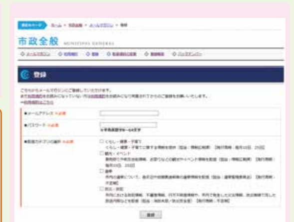
市ホームページの登録ページ画面