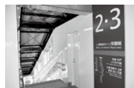
橋上駅ホーム北側階段