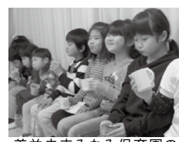
美並未来みなみ保育園の園児の様子

平成30年度茨城県モデル事業として市内4施設(美並未来みなみ保育園・霞ヶ浦保育園・のぞみ保育園・神立幼稚園)でフッ化物洗口がはじまりました。 フッ化物洗口は、歯を丈夫にする(歯質の強化)や初期虫歯の進行を抑える(再石灰化)や細菌の活動を抑制する(虫歯菌の活動抑制)効果があり、保育園の歯磨きタイムの後にみんなそろってうがいするだけの安全なむし歯予防法です。