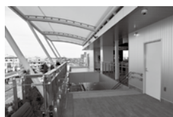
自由通路東西口北側階段