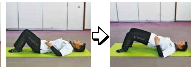
お尻、もの裏側の筋肉を強化する運動