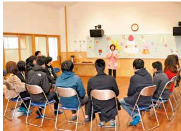
↑保育士の話を熱心に聞き入る参加者たち

2月5、6日の2日間、保育や介護など福祉の仕事に興味のある県外の若者を対象とした「移住定住促進体験ツアー」が開催。市の魅力と生活を伝えるスポットを巡りながら、市内の保育や介護施設を訪問しました。参加者からは「かすみがうら市は山と湖の両方があり、自然にあふれた場所ですととても落ち着きますね」と話してくれました。