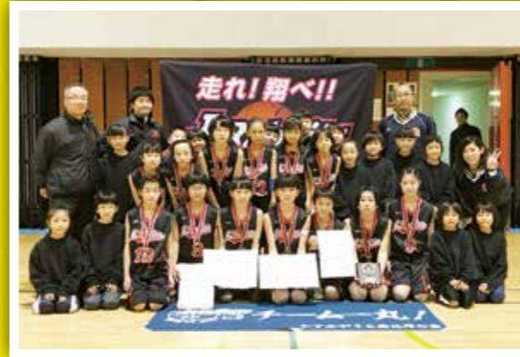
かすみがうら南J・ラビッツ 茨城県ミニバスケットボール選手権大会 (茨城新聞社杯茨城県ミニバスケット ボール選手権大会) 第3位