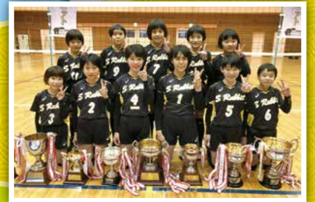
シルバーラビッツスポーツ少年団 全日本バレーボール大会 茨城県大会 女子の部 優勝