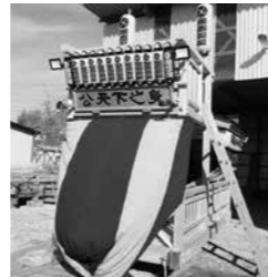
【逆西四区】山車、提灯

この助成金は、宝くじの社会貢献広報事業としてコミュニティ活動に必要な施設や備品を整備するために助成しているものです。