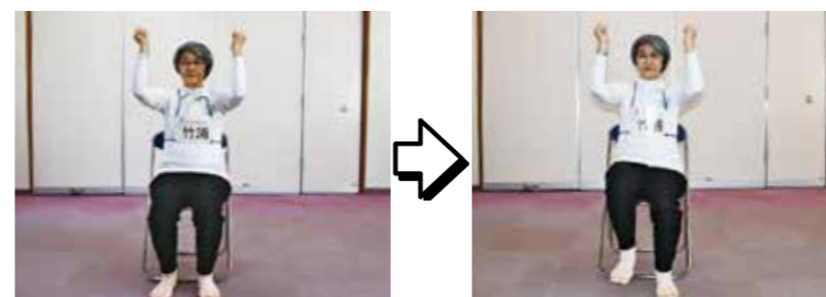
ももを上げる力をつける運動