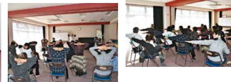
▼皆さんの参加お待ちしております(シルバーリハビリ体操指導士の皆さん)