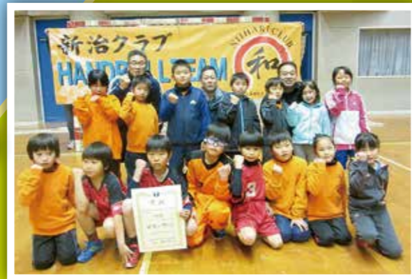
茨城県少年少女 新人ハンドボール大会 低学年混合の部 第2位 新治クラブ