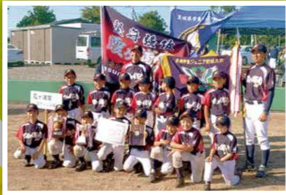
霞ヶ浦南スポーツ少年団 茨城県学童ジュニア野球大会 低学年の部 優勝