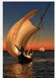
優秀賞 「落陽に染まる」 藤枝 多美男