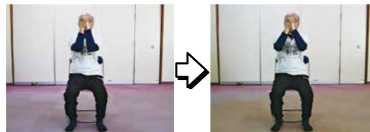
肩関節の動きをよくする運動