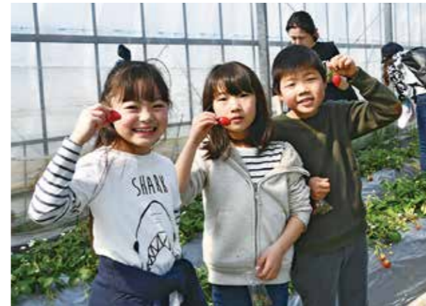
↓旬のいちごを手に取り笑顔が溢れる子どもたち

3月1日、やまゆり保育所で、女の子のやかな成長を願う節句「ひなまつり会」が開催されました。ホールには園児たちが作成したひな飾りが壇上いっぱい並べられ、とても華やかでかわいいひな壇が出来上がっていました。紙芝居でひなまつりの由来について話しを聞き、ひなあられに見立てたボール運びで元気に楽しんでいました。また、ひなあられとひなまつりにちなんだ給食が振る舞われ、園児たちの笑顔であられたひなまつりのお祝いとなりました。