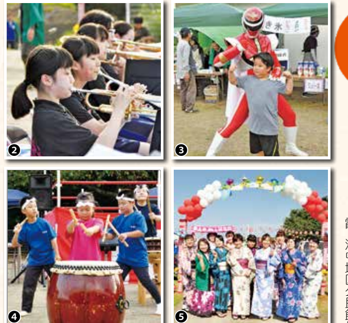
①みんなでワッショイ！子ども神輿②霞ヶ浦中の吹奏楽③ガウラーCとポーズ！④あゆみ太鼓⑤浴衣で集合写真