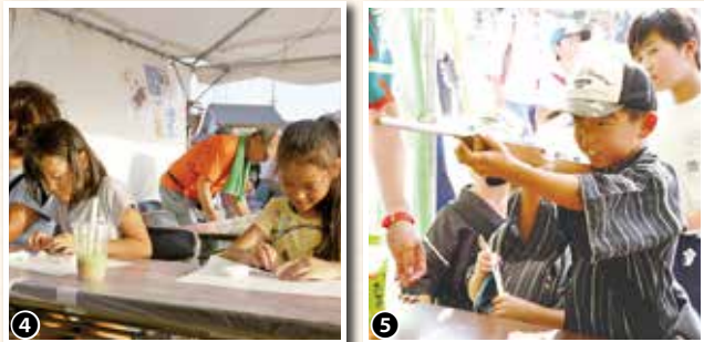
①夏の風物詩「盆踊り」を楽しむ②下稻吉中の吹奏楽③下稻吉東小の合唱④粘土で自由に作成中⑤狙いを定めて！

8月17日、下稻吉中学校で「第4回みんなの夏まつり」が開催されました。このお祭りは、地域の自主性・独自性を尊重した、住みやすい地域づくりを目的に実施されています。 夏空の中、風情を満喫するために多くの地域住民が参加し、交流を深めていました。参加者からは「毎年楽しみにしているお祭りなので、家族みんなで満喫しました」「夏休みの良い思い出になりました」などと話してくれました。 子どもから大人まで、世代を超えて一緒に楽しめる夏まつりは、参加した皆さんにとって素敵な夏の思い出となったことでしょう。 【主催】みんなの夏まつり実行委員会 下稻吉中地区公民館