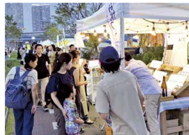
↑地ビールなど市の特産品に興味津々の観光客

8月23日、24日、新豊洲駅付近で東京ガス(株)主催の「新豊洲サマーナイトマルシェ」に(株)かすみがうら未来づくりカンパニーが出店。ふるまる厳選米のお酒や佃煮など市の特産品を販売し、中でも氷水で冷やした地ビールは大好評でした。『フルーツフレーバービール』は「甘すぎず飲みやすい」との感想があり、男女問わず多くの方が購入していきま