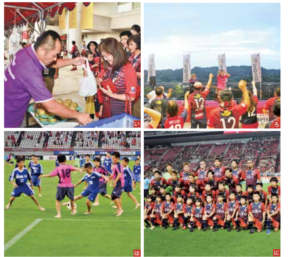
い毎年行列ができる市名産の梨を購入するサポーターの皆さん るオニツカサラーさんライブに熱狂 は試合開始前にグラウンドでサッカー体験する少年たち に憧れの選手たちと記念撮影に緊張顔

8月23日、茨城県立カシマサッカースタジアムで「フレンドリータウンデイズかすみがうらの日」に本市の特産品のPR・販売を開催。市名産の梨は300個準備しましたが、販売開始後30分で完売するほどの人気。また、ふるさと応援隊ガウラーCとの写真撮影やオニツカサラーさんのライブによる市のPR活動を行い、会場は熱気に包まれました。グラウンドでは、市のスポーツ少年団が裸足でサッカーを行い、プロが使用するグラウンドの芝で存分にプレーを楽しみました。憧れの選手たちとの記念撮影は子どもたちにとって最高の思い出となったことでしょう。