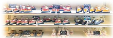
マルシェ利用者数