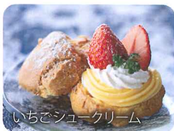
いちごシュークリーム

いちごがおいしい季節になりました。フレッシュないちごメニューが期間限定で登場！ 旬のオリジナルスイーツをお楽しみください！