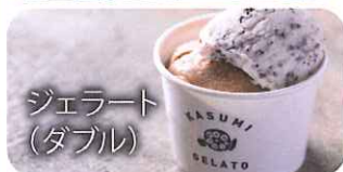
ジェラート (ダブル)