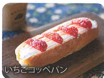
いちごコッペパン