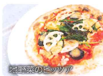
地野菜のピッツア