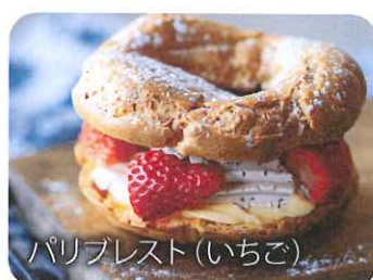
パリプレスト(いちご)