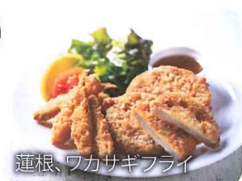
蓮根、ワカサギフライ