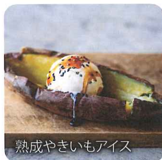
熟成やきいもアイス