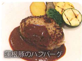
蓮根豚のハンバーグ

かすみがうら市交流センター2Fのかすみキッチンでは、霞ヶ浦で水揚げされたシラウオの Pasta や、地元のブランド豚「蓮根豚」のハンバーグ、地野菜たっぷりのピッツアなど、季節ごとの地産地消メニューをお楽しみいただけます。