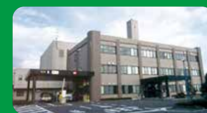
【環境クリーンセンター】

環境クリーンセンターの閉鎖後は、ご家庭から出る一般廃棄物の自己搬入につきましては、新たな広域ごみ処理施設をご利用いただくことになります。