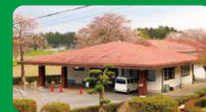
【老人福祉センター「ふれあいの里」】