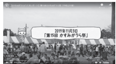
▲かすみがうら市ホームページ「かすみがうらムービー」

A 広報誌編集を一部民間に委託しているものと、ホームページに掲載する映像制作の委託料となります。