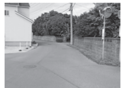
▲市道8-4408号線（稲吉4丁目）

A 道路排水の構造物が未整備であることから、道路の表面排水の処理をするために新たに側溝を設置する工事を予定しております。