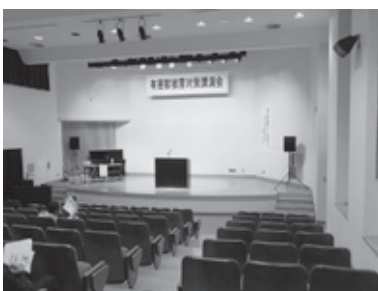
▲あじさい館視聴覚室