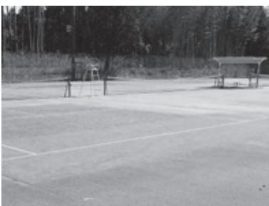
▲多目的運動広場テニスコート

社会情勢を受け、前年度対比4.1%の増の192億9300万円を計上し、各種事業を実行するための予算を計上するものです。