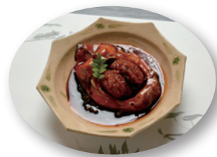
霞ヶ浦の郷土食 「絶品の鯉の旨煮」