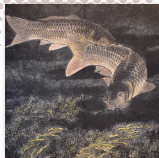
鯉釣名人であった霞ヶ浦の 画家「小林恒岳」の作品