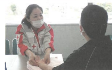
こころのケアを行う看護師