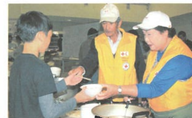
避難所で炊き出しを行うボランティア