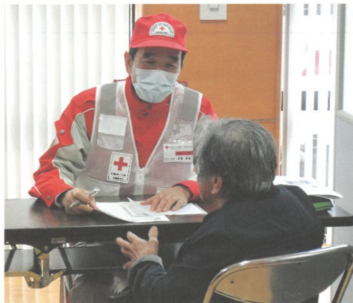
町保健センターに開設した救護所で被災者を診察する医師