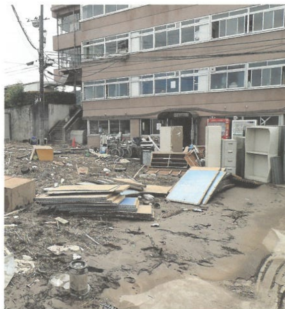
浸水被害を受けた町役場庁舎