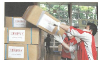
避難所に救援物資を届ける救護要員