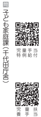
図 子ども家庭課（千代田庁舎）

児童手当・特別給付を受けている方は、現況届を6月までに、児童扶養手当を受けている方は、現況届を8月までに、提出する必要があります。まだ、提出されていない方は、至急提出をお願いします。※提出がない場合は、手当を受けることができませんので、ご注意ください。