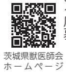
図 公益社団法人茨城県獣医師会