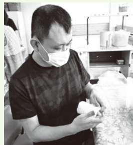
フルーツキャップ作り