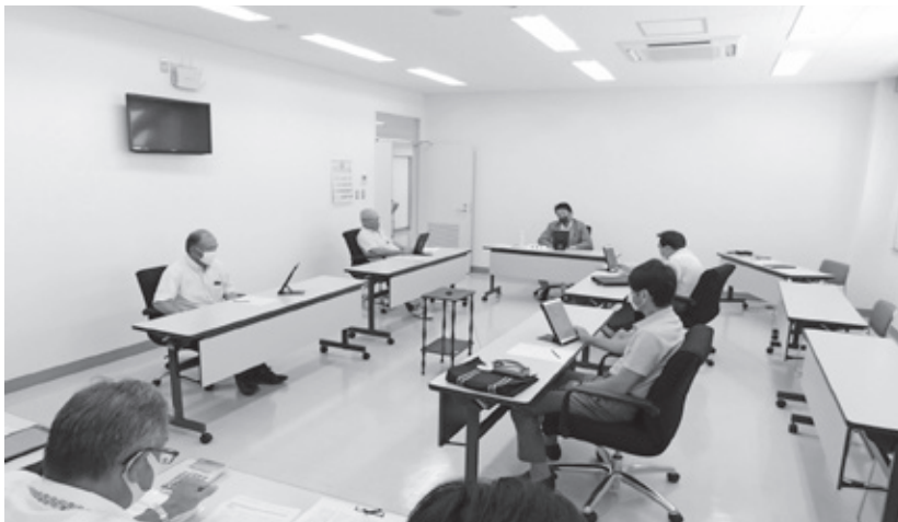
▲説明を受ける委員 (千代田庁舎委員会室)