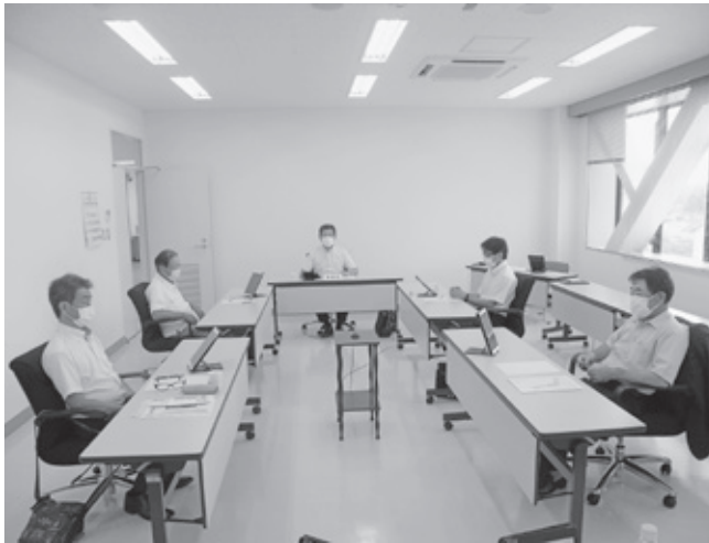
▲説明を受ける委員 (千代田庁舎委員会室)