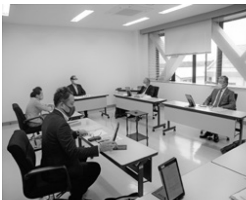
▲説明を受ける委員 (千代田庁舎委員会室)