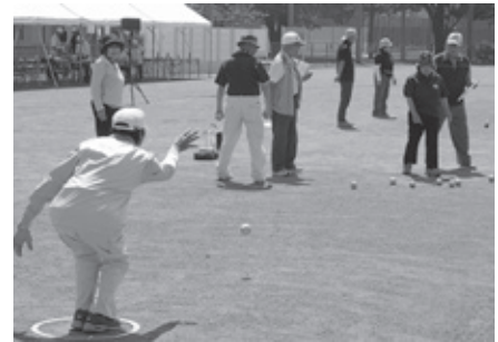
▲わかぐり運動公園で実施されたいきいき茨城ゆめ国体プレ競技 ペタンク

A 下稲吉中学校体育館の用地取得や旧安食小学校の博物館収蔵施設への用途変更工事、また、いきいき茨城ゆめ国体2019の実行委員会の補助等となっております。