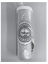
▲市で配布している救急医療情報セット