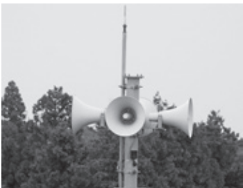
▲防災無線施設（上土田地内）