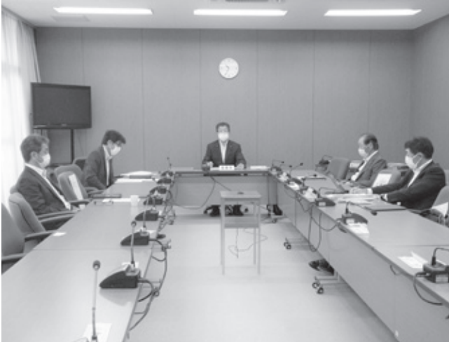
▲説明を受ける委員 (千代田庁舎全員協議会室)

「新型コロナウイルス感染症の影響に伴う地方財政の急激な悪化に対し地方税財源の確保を求める意見書(案)」について ●市地域公共交通計画策定について ●SDGs投資について ●広報誌及び市ホームページのリニューアルについて