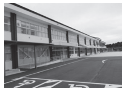
▲かすみがうらウエルネスプラザ

A 市内施設の水道蛇口をレバー式に交換するもの、来場者の体温を検知するサーマルカメラをウエルネスプラザに設置するもの。また、土浦保健所管内のPCR検査を実施する地域外来検査センターへの負担金となります。