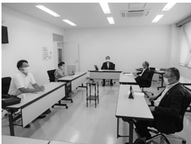
▲説明を受ける委員 (千代田庁舎委員会室)