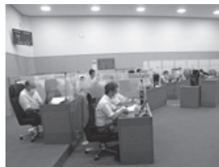
▲決算審査特別委員会での審査の様子(千代田庁舎議場)