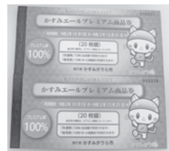
▲かすみエールプレミアム商品券

A 今回、茨城県の補正予算で地域企業活力向上応援事業補助金5748万3千円が市に交付されましたので、こちらを財源として当初の予定から1冊プラスし、1世帯当たり2冊購入できるものです。