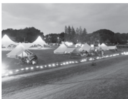
▲自転車×キャンプをテーマとしたかすみがうらライドヴィレッジの様子 (歩崎公園)

Q 観光サイクリング事業のかすみがうらアクティビティコミッション補助金400万円の内容は