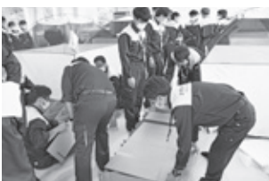
▲避難所開設訓練の様子 (ウエルネスプラザ)