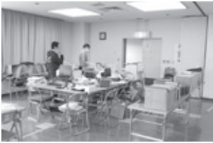
▲サテライト勤務の様子 (千代田公民館)