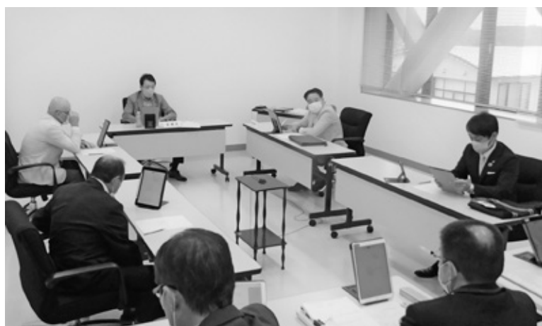
▲説明を受ける委員 (千代田庁舎委員会室)