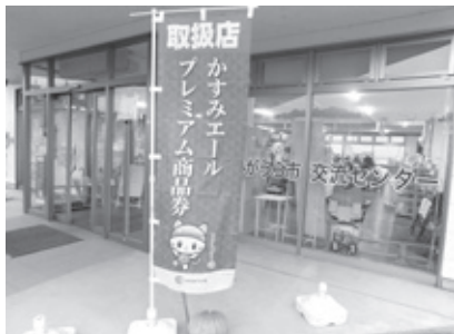
▲かすみエールプレミアム商品券取り扱い店のぼり