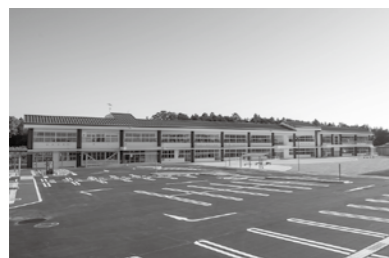
かすみがうらウエルネスプラザ