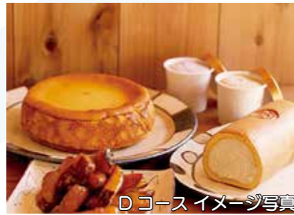
Dコース イメージ写真

かすみがうら市産のブランド豚「蓮根豚」と、茨城県が誇るブランド牛「常陸牛」の盛り合わせ。甘い口溶けの脂に癒されます。シンプルに塩こしょうで焼くだけで肉の旨味があふれます。