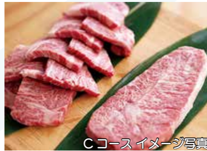
Cコース イメージ写真

かすみがうら市の特産物を使ったクラフトビール「BASSRISE（パスライズ）」とおつまみのセットです。フルーティな味わいのビールは4つの味を2本ずつお届け。家でくつろぐ時間に楽しんでください。