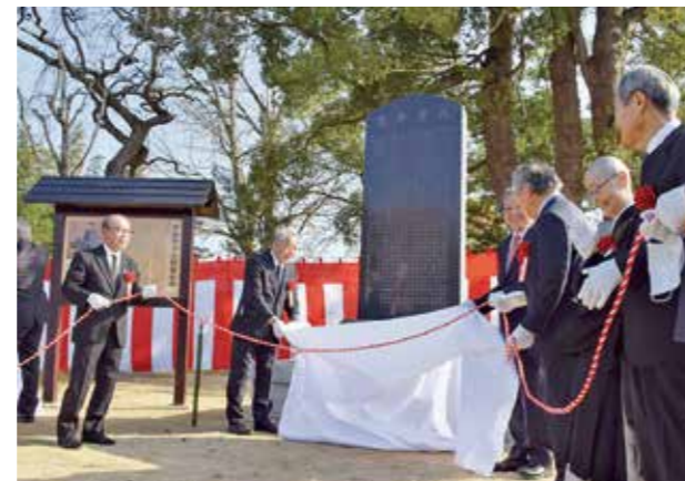
↑ 顕彰碑は樹齢500年超といわれるクスノキの前に建立

11月18日、伊東甲子太郎の命日に、志筑城跡(旧志筑小学校敷地)で「伊東甲子太郎顕彰碑除幕式」が行われました。伊東甲子太郎は旧中志筑村出身で、幕末に新選組の「参謀」を務めました。顕彰碑は、地域活性化のための活動をしている『中志筑史源保全の会』が市のまちづくりファンドを活用し、伊東甲子太郎の功績を後世に伝えるため建てられました。顕彰碑の除幕式には関係者や多くの地域住民が集まり、先人の足跡を称えました。