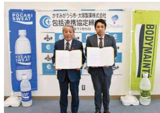
↑ 大塚製薬株式会社と地域の活性化を図るため協定を締結

11月5日、「かすみがうら市と大塚製薬株式会社との包括連携協定」の締結式が行われました。この協定により、大塚製薬株式会社と緊密な相互連携と協働による活動を推進し、『地域社会の活性化と市民の安全・安心な暮らしを確保』するため、健康増進やスポーツ振興、食育、防災などで協力していきます。今後は、生活習慣病予防に関する食育や災害に関する支援など、市民の健康維持や増進、地域の活性化を図っていきます。