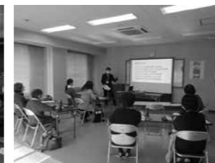
↑市民子育て支援員

▶ 出前講座とは 市民の皆さんが(行政区、市民団体、学校、企業などの5人以上の団体)が、出前講座メニューから講座を選び、会場を確保の上、申し込みます。申し込みを受けた講座担当部署の職員などが会場に講師として出向き、講座内容の説明や意見交換を行います。