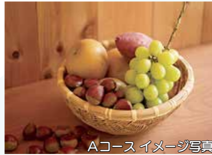
Aコース イメージ写真