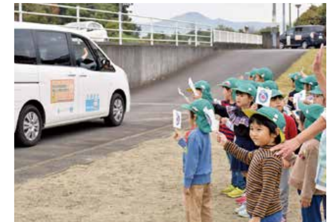
↑ リレーカーに啓発運動の旗を振るわかぐり保育所の子どもたち

11月6日、茨城県内で「子どもを守ろう! オレンジリボンたすきリレー 2020」が行われました。『オレンジリボン』は、子どもの虐待をなくすことを呼び掛ける運動のシンボルマークです。今回は、新型コロナウイルス感染症の影響により、車によるリレー運動となりました。市内では、わかぐり保育所や千代田中学校など子育て世帯が多い地区を回り、「子どもを守ろう」を合言葉に啓発運動が行われました。