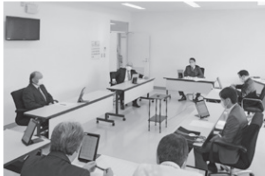
▲説明を受ける委員 (千代田庁舎委員会室)