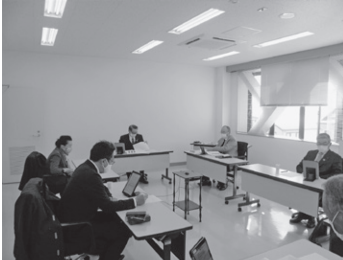
▲説明を受ける委員 (千代田庁舎委員会室)