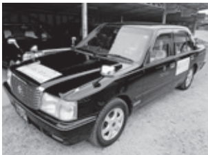
▲乗合タクシー（千代田地区）