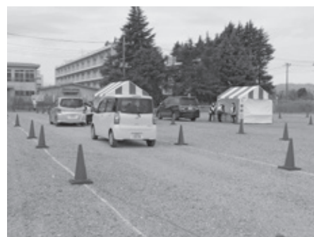
▲プレミアム商品券ドライブスルー販売の様子 (新治地内)

A 現在発行中のかすみエールプレミアム商品券の 第2弾として、第1弾と同様の条件で実施する ための予算を計上したものです。販売は1月18 日から2月26日までとし、使用期限を令和3年 3月14日とするものです。