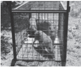
▲市内で捕獲されたイノシシ

Q イノシシの捕獲数は上がっても、繁殖に追いつかず、年々生息範囲を広げ、自動車との衝突事故が発生するなど住民生活の場にも被害が拡大している。桜川市やつくば市、石岡市などは、鳥獣対策の対策強化が図られていると聞かすが本市の対応について伺う。 A 都市産業部長 イノシシ対策についての市民の共通理解と地域対策の重要性を促しながら、特に農業被害が多い地域の方々のご理解とご協力のもと、また県及び関係機関との連携や助言・協力をいただいた中で、地域と一体となったイノシシ対策を取り組む体制構築の推進を図ってまいります。近隣市におきましては、有害鳥獣に係る対策室の新設など、対策強化に向けた取組などが行われています。繁殖スピードが速いイノシシ対策は、本市でも大きな行政課題の一つと考えておりますので、今後の対策強化の推進に当たり、対策室などの専門的な部署の必要性を感じているところでございます。