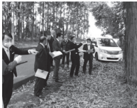
▲市道路線廃止個所の現地調査 【下土田地内】