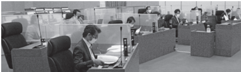
▲議員席の間に飛沫防止のため間仕切りを設置しました。