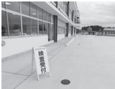
▲ドライブスルー方式で行われた新型 コロナウイルス感染症検査会場 (かすみがうらウエルネスプラザ)