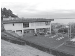
▲農村環境改善センター