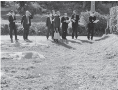
▲市道路線廃止個所の現地調査 【市川地内】