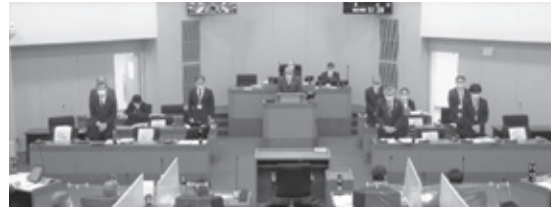
▲執行部はソーシャルディスタンス確保のため最低限の入場としました。

令和2年第4回定例会が、11月30日から12月15日までの16日間の会期で開催されました。今定例会では歳入歳出予算の総額に、それぞれ5億6346万9千円を追加し、歳入歳出予算の総額を、それぞれ253億3105万9千円とする令和2年度一般会計補正予算など、議案25件を慎重審議し、市道路線の廃止について1件を除くいずれの議案も可決となりました。また、12月1日から3日の3日間において一般質問（後頁P6～9）を行いました。