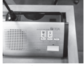
▲議員はボタンを押して賛否を表明します