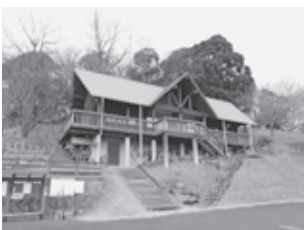
▲三ツ石森林公園もりの小屋

質問通告事項 1 雪入山・浅間山周辺のハイキングコースの維持管理と環境保護について 2 小中学校の新型コロナウイルス対策による教職員の負担増への対応と生徒・児童の学習時間の確保について