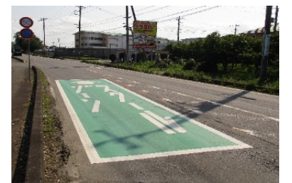
●交通安全施設等の整備イメージ