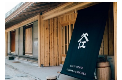
●ゲストハウス「古民家 江口屋」