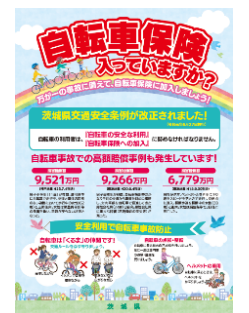
●自転車保険加入啓発ポスター