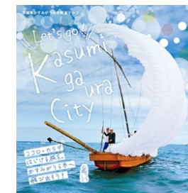
●かすみがうら市観光マップ