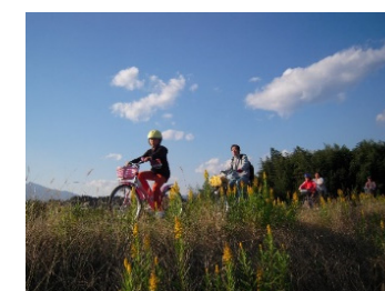
●恋瀬川サイクリングイベント