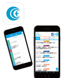
●かすみがうら市公式アプリ