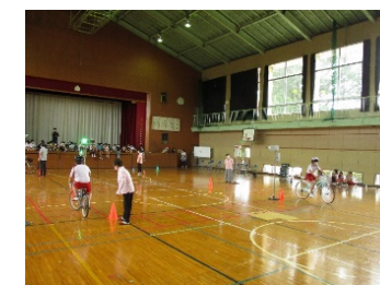
●交通安全教室の実施風景（新治小学校）