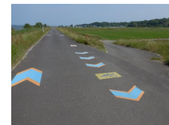
●矢羽根の整備イメージ