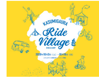
●かすみがうらライドヴィレッジ