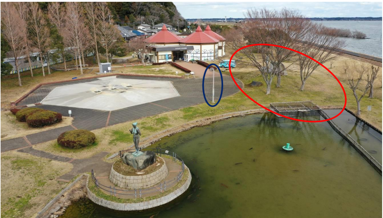
写真2：歩崎公園内、水族館周辺（赤丸は複合デッキ設置予定場所、青丸は既存外灯）