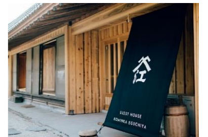
●ゲストハウス「古民家 江口屋」