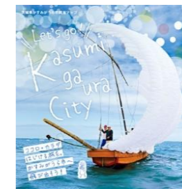
●かすみがうら市観光マップ