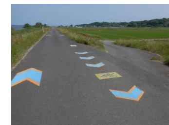
●矢羽根の整備イメージ