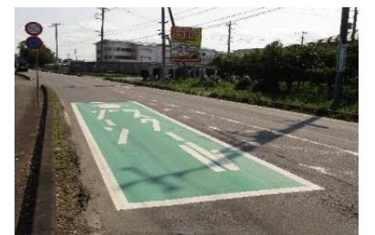
●交通安全施設等の整備イメージ