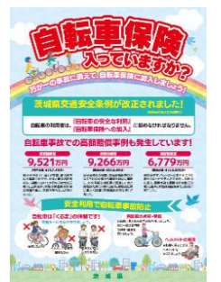
●自転車保険加入啓発ポスター