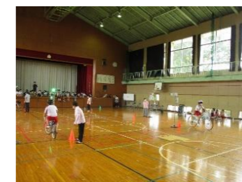
●交通安全教室の実施風景（新治小学校）