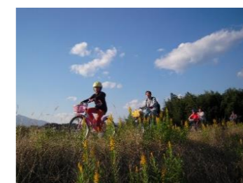
●恋瀬川サイクリングイベント