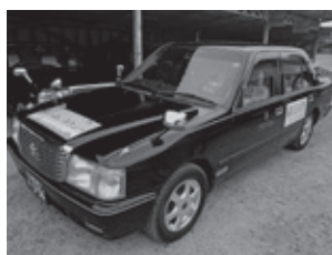
▲デマンド型乗合タクシー

3211 質問通告事項 新型コロナウイルスに対するワクチン接種について デマンド型乗合タクシーの存続について 地域農業と経済の活性化のための地産地消促進について