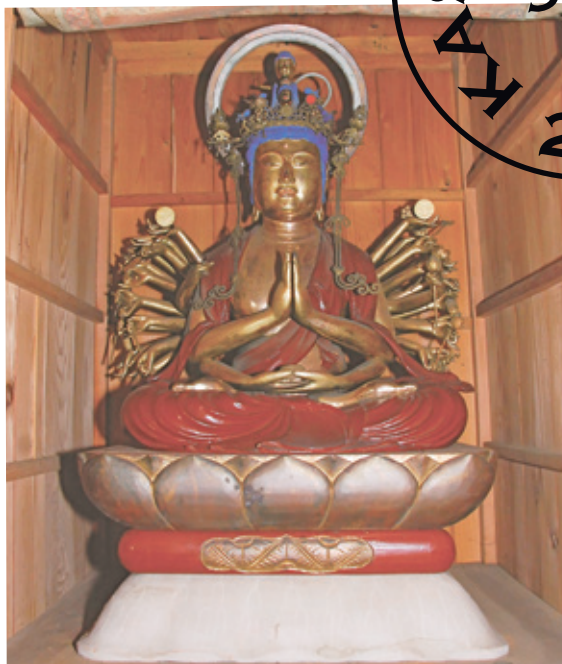
▲木造千手観音菩薩坐像(安食 福蔵寺)