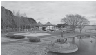
▲歩崎公園の様子（坂地内）