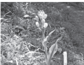
▲キンラン(三ツ石森林公園内)