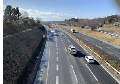
(常磐自動車道千代田パーキングエリア付近)

常磐自動車道の千代田パーキングエリアへの設置を計画しているスマートインターチェンジの整備に向け、令和元年度までに策定した計画をさらに具体化するとともに、関係機関との協議を進めるため、令和2年度に「スマート IC 実施計画策定業務」を委託したものである。