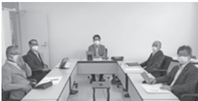
▲説明を受ける委員 【千代田庁舎委員会室】