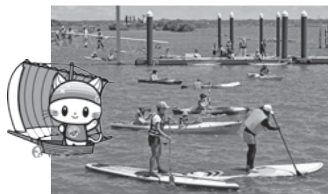
▲かすみがうらフェスタ2021の様子 (会場となった歩崎棧橋周りの霞ヶ浦の湖上)

A これまで力を入れてきたサイクリング事業に加え、多角化ということで、湖上のアクティビティにも力を入れていきます。具体的には、水上自転車で湖上をサイクリングしたり、丸い形をしたSUPなどを使って湖上でピクニックを楽しむといった事業の取り組みを予定しております。