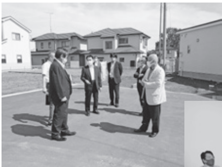
▲市道路線認定箇所の現地調査 【下稲吉地内】