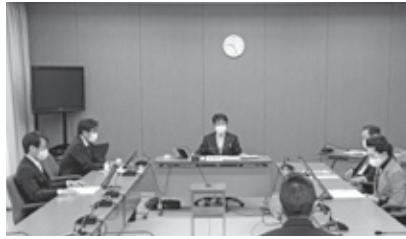
▲説明を受ける委員 【千代田庁舎全員協議会室】