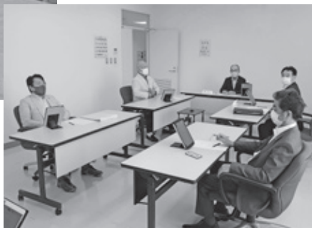
▲説明を受ける委員 【千代田庁舎委員会室】