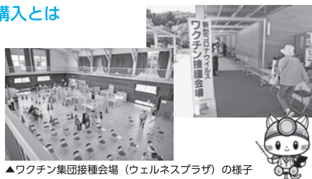
▲ワクチン集団接種会場(ウェルネスプラザ)の様子

A 保育所または学校等、集団生活の場で万一陽性者が出た場合、濃厚接触者でPCR検査対象者以外の接触者の方たちの自主検査等を目的として、抗原検査キット2,000セットを購入、金額につきましては264万円を計上させていただきました。